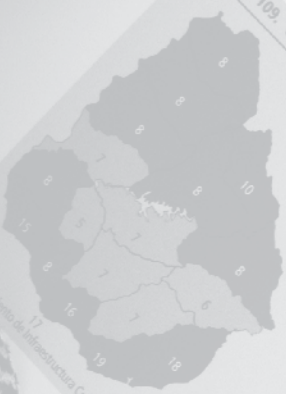
Gráfico 109. Cantidad de estaciones de radio AM y FM según departamento, 2003

Al igual que la televisión, la radio es un artefacto con el que cuentan la mayoría de los hogares uruguayos. Según se observa en los mapas del gráfico 109, Montevideo es el departamento que posee más cantidad de estaciones AM y FM de Montevideo es inversa a la que se observa en el resto de los departamentos, donde se poseen más estaciones FM. Los departamentos