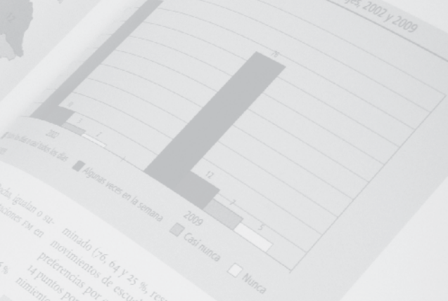
Cuadro 59. Tipos de programas de radio que se escuchan, en porcentajes, 2002 y 2009