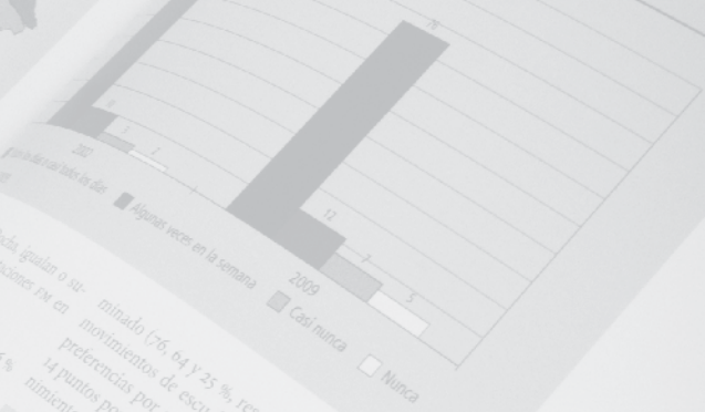
Cuadro 59. Tipos de programas de radio que se escuchan, en porcentajes, 2002 y 2009