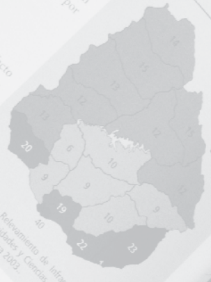
Gráfico 108. Total de estaciones de radio según departamento, 2003