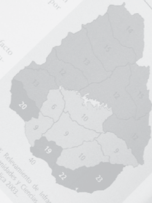
Gráfico 108. Total de estaciones de radio según departamento, 2003

Fuente: Relevamiento de Infraestructura Cultural, Facultad de Humanidades y Ciencias de la Educación, Universidad de la República, 2003.