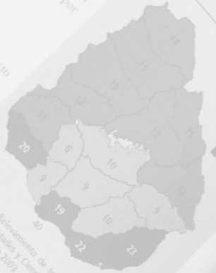
Gráfico 108. Total de estaciones de radio según departamento, 2003