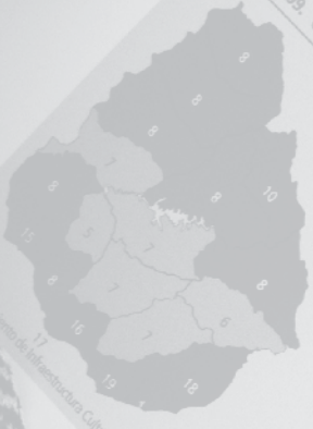
Gráfico 109. Cantidad de estaciones de radio AM y FM según departamento, 2009