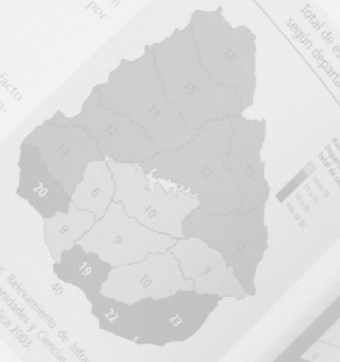
Gráfico 108. Total de estaciones de radio según departamento, 2009