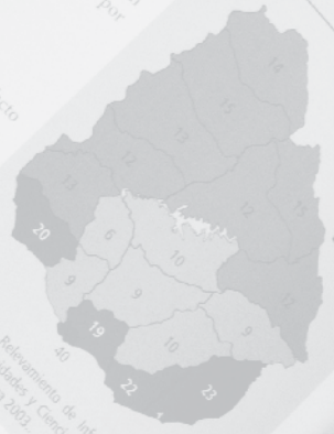
Gráfico 108. Total de estaciones de radio según departamento, 2003