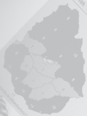
Gráfico 109. Cantidad de estaciones de radio AM y FM según departamento, 2003

Al igual que la televisión, la radio es un artefacto con el que cuentan la mayoría de los hogares uruguayos. Según se observa en los mapas del gráfico 109, Montevideo es el departamento que posee más cantidad de estaciones AM y FM. La relación entre las estaciones de radio AM/FM de Montevideo es inversa a la que se observa en el resto de los departamentos, donde se poseen más estaciones FM. Los departamentos